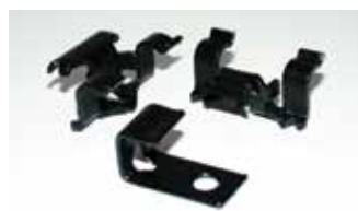
Phantom festeklips for Terranova