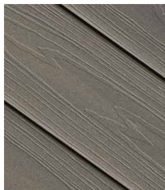
Xtreme Aspen Multifarget

På gjevnt lavtbyggende underlag anbefales Easyfix bjelkesko i gummi for nødvendig lufting og forebygging av råte på tilfarare. Byggehøyde: 10–50 mm