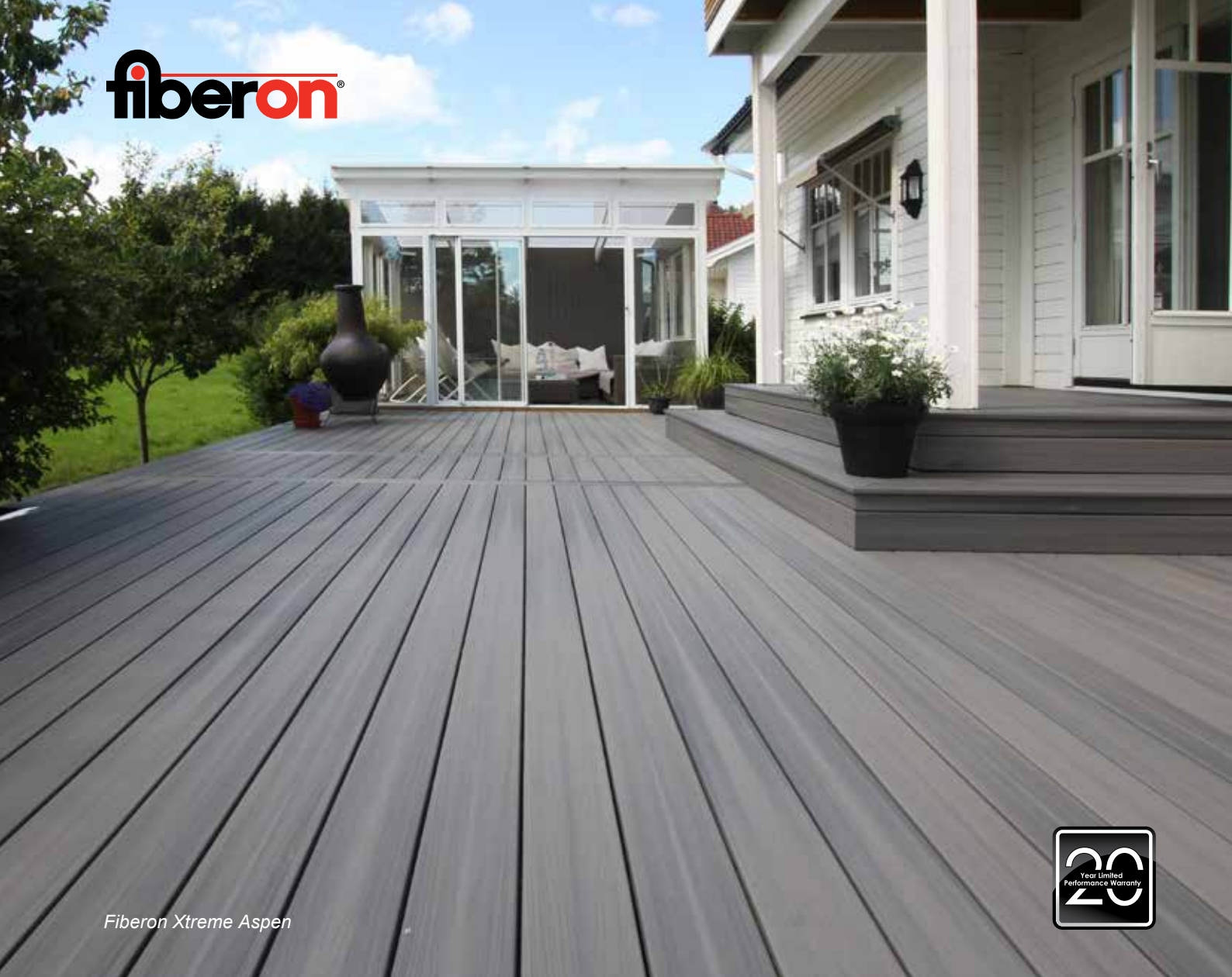
Fiberon Xtreme Aspen