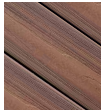
Xtreme Acron Multifarget